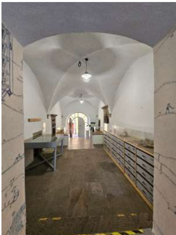
Otvorený depozitár zbierky geológia - vstupná chodba