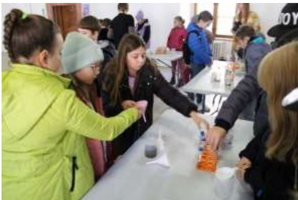
Veda o vode, Galéria J. Kollára