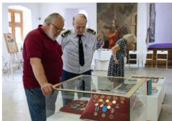
Výstava Cesty hrdinov, Galéria Jozefa Kollára