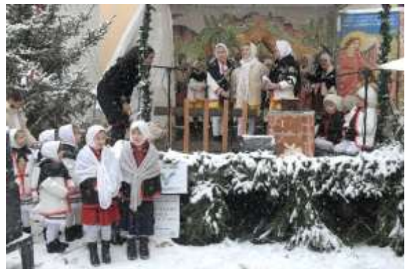
Štjavnycký vianočný jarmok, Kammerhof