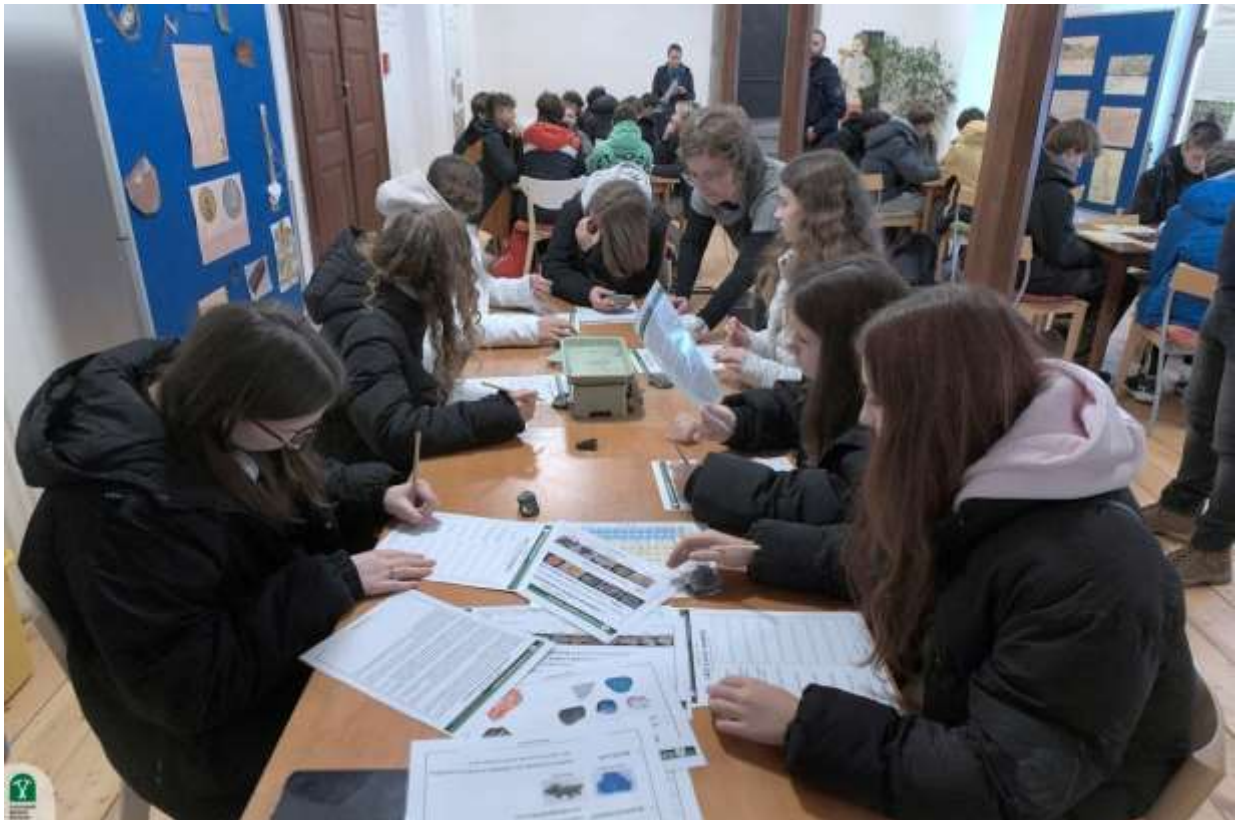
Edukačný program – Mineralógia od A po Z, Kammerhof

Počas LTS 2024 (máj-september) boli tržby z prevádzky expozícií vo výške 410 924 €. V porovnaní s rokom 2023 ide o nárast o 14 803,50 € (3,74 %). V porovnaní s najúspešnejším rokom 2019 dosiahli tržby nárast o 72 534,10 € (+21,44 %). V mesiacoch júl a august činili tržby 243 171 € čo predstavuje nárast o 7 315 € oproti tržbám za rovnaké obdobie roka 2023 (235 856 €;) a v percentuálnom vyjadrení nárast 3,10 %.