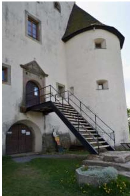
Renovácia schodiska, Nový zámok