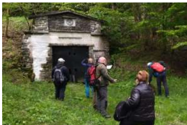
Osudy parného kompresora, Banské múzeum v prírode Od Terezky do Huty, montánná vychádzka