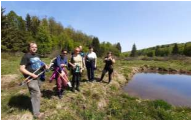
Brigáda k Svetovému dňu mokradí, Banský Studenec

Medzi tradičné podujatia, ktoré múzeum organizuje, sa radí aj podujatie, ktorého hlavnou myšlienkou je podporiť a popularizovať Európske dni archeológie . Pri tejto príležitosti múzeum pripravilo zaujímavú prezentáciu histórie, architektúry a archeologických nálezov Starého zámku pod názvom S archeológom v Starom zámku . Program zastrešoval múzejný archeológ.