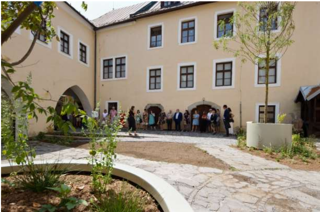
Záverečná konferencia projektu GREEN MISSION / ZELENÁ MISIA, Kammerhof