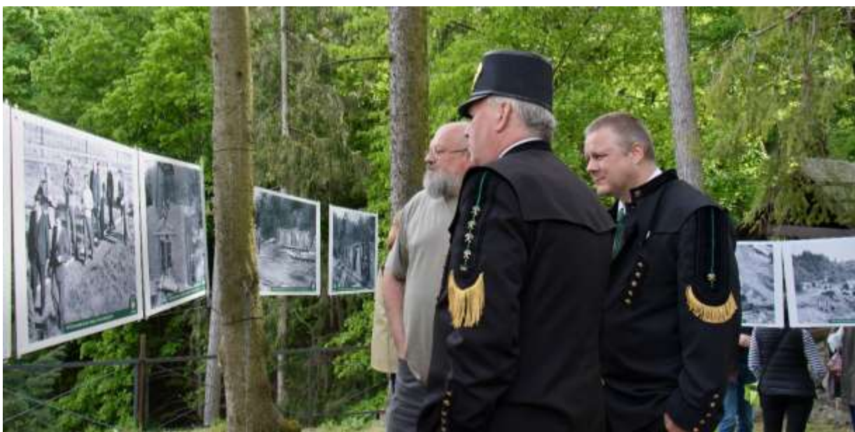
Exteriérová výstava Záblesky z cesty časom – 50 rokov Banského múzea v prírode, Banské múzeum v prírode