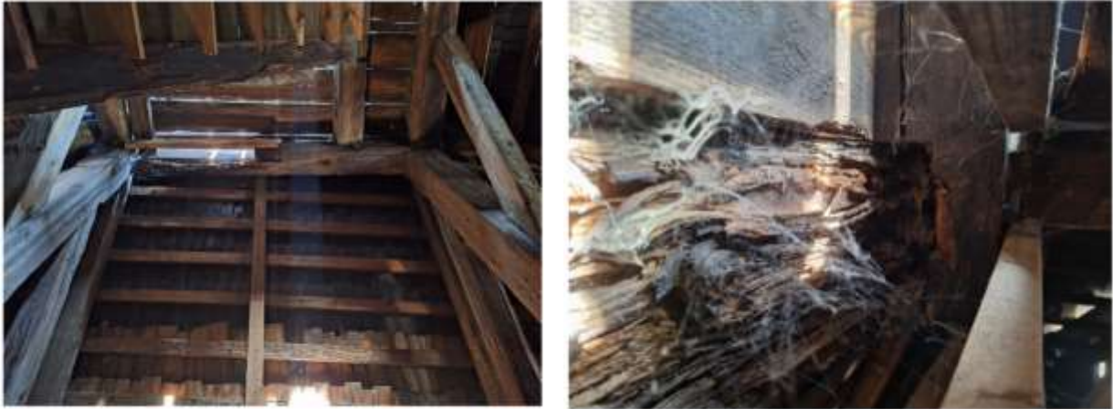
Poškodený krov objektu Klopačka