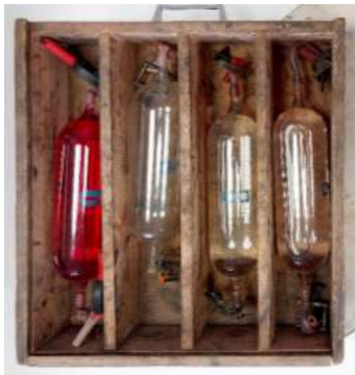
Akvízie zbierky novšia história v roku 2024: Výrobky firmy Kovolessk a súprava na odber ovzdušia