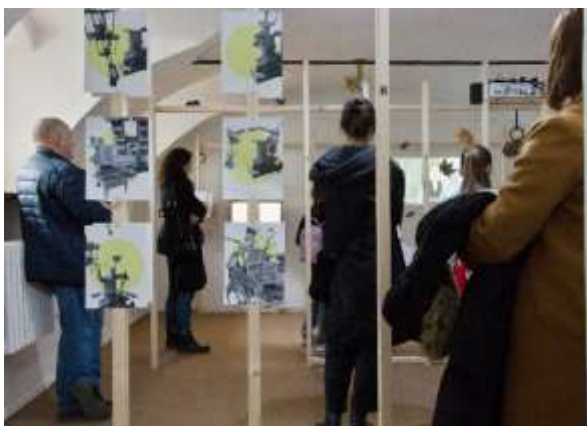
Galéria Jozefa Kollára, výstava Tiché správy Zeme

V rámci činností zameraných na medzinárodnú spoluprácu múzeum zrealizovalo: Dňa 9.5.2024 sa Slovenské banské múzeum, ako ambasádor Európskeho klimatického paktu , prezentovalo na podujatí Deň Európy 2024 v Starej tržnici v Bratislave spoločne s iniciatívou Európsky klimatický pakt. Podujatie bolo symbolickou oslavou 70. výročia založenia Európskej únie. Počas tohto podujatia sa formou informačných stánkov tiež prezentovala Európska komisia, Európsky parlament a členské štáty EÚ. Pre návštevníkov boli pripravené workshopy, hry, kvízy a súťaže, ktoré obohatili ich poznatky a zážitok z podujatia. Tiché správy Zeme/LET THE SILENCE BE HEARD Táto výnimočná výstava, ako súčasť projektu Zelená misia – Slovenské banské múzeum pre klímu, predstavila práce detí z Banskej Štiavnice a Nórska, ktoré vytvorili v spolupráci s umelcami počas tvorivých workshopov na tému umenie a klimatická zmena. Museums & Galleries of the 21 st century together against the threats of climate crisis. V odbornom programe dvojdňového podujatia v 7. tematických blokoch bolo uvedených 39 konferenčných príspevkov autorov, autoriek alebo tímov, ktoré reprezentujú nielen múzejné a galerijné inštitúcie, ale aj vysoké školy, odborné organizácie, nezávislé iniciatívy či podnikateľské prostredie. Kolokvium sa uskutočnilo v Rytierskej sále Starého zámku, a to 26. - 27.6.2024.