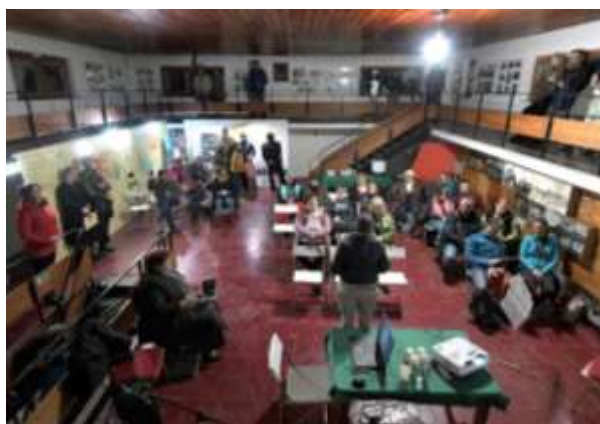
Dušičky z Nového zámku, Nový zámok

Zimné a predvianočné obdobie bolo v múzeu v roku 2024 spríjemnené Štjavným vianočným jarmokom . Jarmok bol organizovaný v nádvorí Kammerhofu. Počas oboch dní jarmoku nechýbala vianočná rodinná hra v expozícii Kammerhof-Baníctvo na Slovensku TAJOMSTVO VIANOC , ktorá prepojila zbierky expozície s Vianocami a ich posolstvom. Múzeum vystavilo počas jarmoku unikátny betlehem, ktorý obohatil prehliadku expozície, ale slúžil aj ako pozvánka do Starého zámku, kde bola pripravená výstava Chrámové betlehemy. Súčasťou podujatia boli aj Vianočné haraburdy , ktoré ponúkli vianočný sortiment a zamerali sa na osvetu znovu používania a minimalizácie spotreby aj počas Vianoc. Predvianočné obdobie obohatila aj ponuka Ekodielničky, kde v pondelok si vyrábali ľadové vločky, v utorok sa vyučovala maľba na hodváb, v stredu sa pripravovali papierové ozdoby na stromček, vo štvrtok sa vyrábalo krmivo pre vtáčiky a v piatok návštevníkov opantala vôňa pečených medovníčkov. Zamestnanci múzea a ich rodiny sa zapojili do iniciatívy, ktorá už 6 rokov teší seniorov a seniorky na Slovensku: KOLKO LÁSKY SA ZMESTÍ DO KRABICE OD TOPÁŇOK? Krabičky s užitočnými maličkosťami a dobrotami boli odovzdané seniorom a seniorkám v Domove MÁRIE.