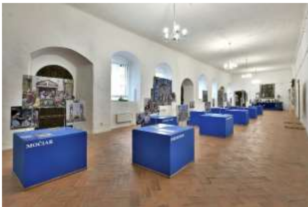
Výstava Chrámové betlehemy, Starý zámok