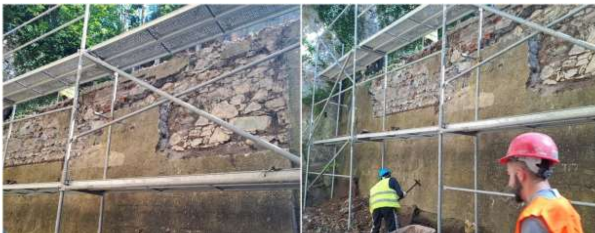
Sanácia oporných múrov a príľahlého svahu s odvodnením, Berggericht