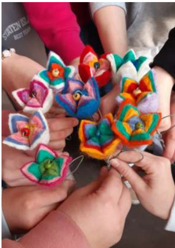
Tvorivé dielne v Dielničke, Kammerhof