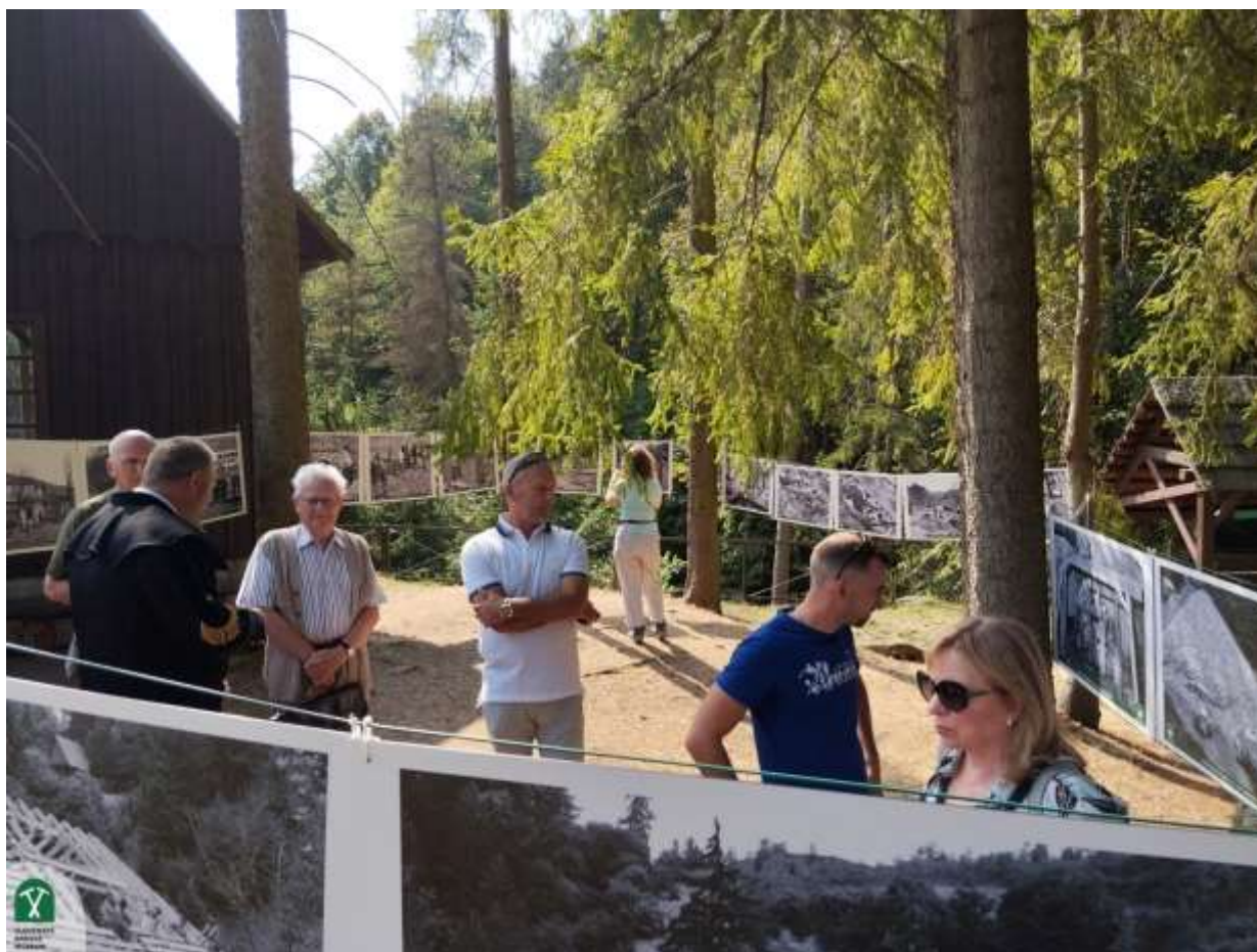
Výstava Záblesky z cesty časom – 50 rokov Banského múzea v prírode, Banské múzeum v prírode

SBM výsledkami v oblasti základných odborných múzejných činností zásadne ovplyvňuje kvalitu života spoločnosti. Aktivitami v oblasti rozvoja cestovného ruchu v lokalite svetového dedičstva UNESCO prispieva k ekonomickému a sociálnemu rozvoju.