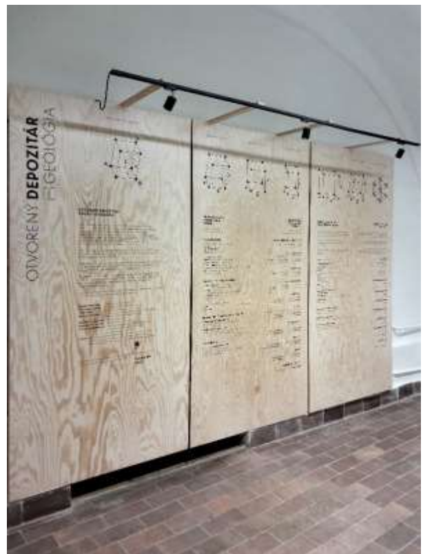
Otvorený depozitár zbierky geológia - informačné panely