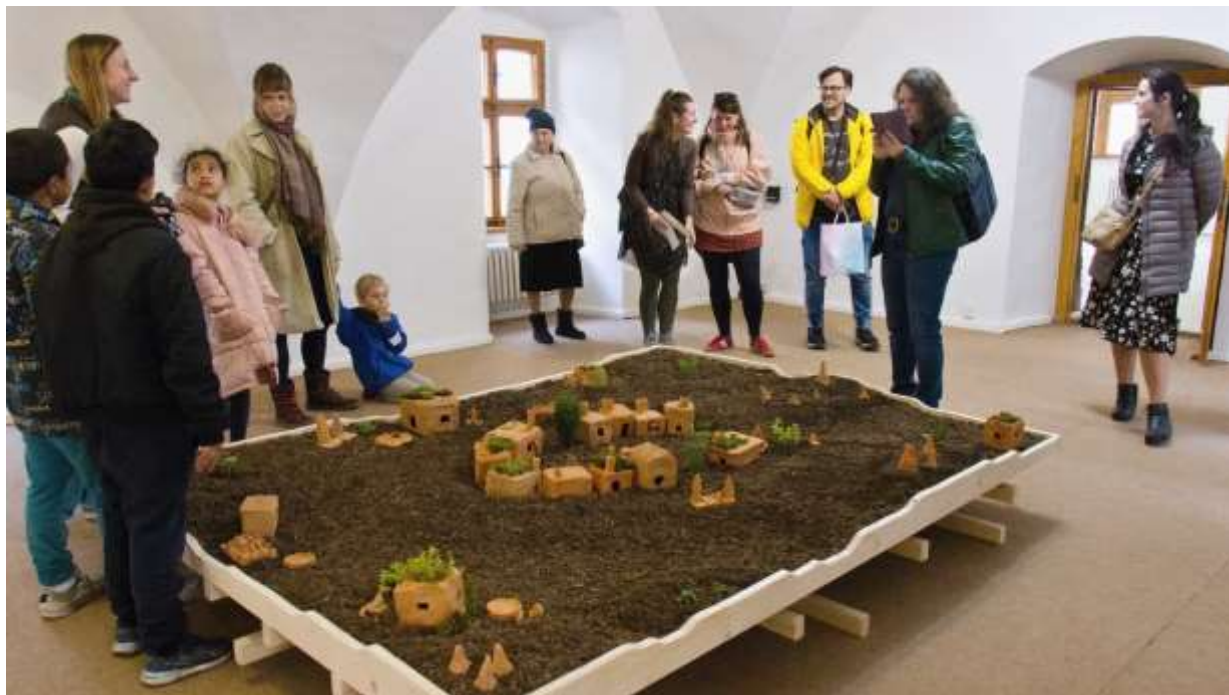
Vernisáž výstavy Tiché správy Zeme /LET THE SILENCE BE HEARD, Galéria Jozefa Kollára

V roku 2024 bol po niekoľkoročnej prestávke vyhlásený 22. ročník medzinárodnej výtvarnej súťaže MY SA NEVIEME SŤAŽOVAŤ NAHLAS so zameraním na ochranu prírody a environmentálnu výchovu. Vyhodnotenie súťaže a vernisáž výstavy s rovnomeným názvom MY SA NEVIEME SŤAŽOVAŤ NAHLAS s témou VODA OKOLO NÁS Máme jej dosť pre všetkých? sa uskutoční 10. marca 2025.