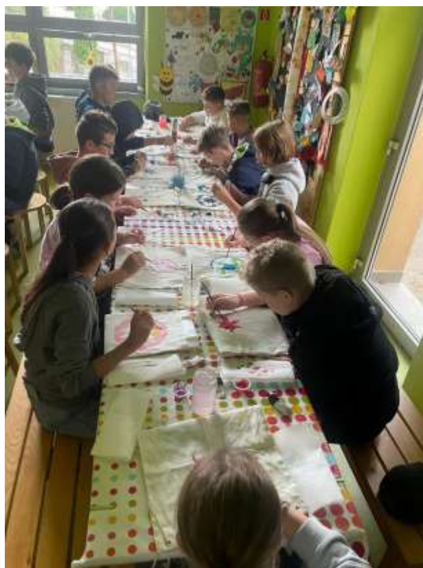
Tvorivé dielne v Ekodielničke, Uhoľná expozícia Handlová