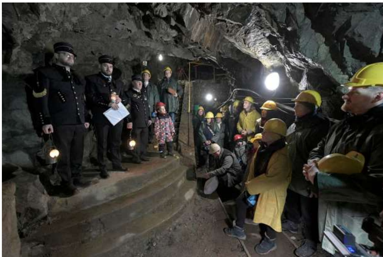
Betlehemské svetlo v bani, Banské múzeum v prírode

V roku 2024 bolo podané 1 podanie označené ako sťažnosť, ktorá avšak podľa obsahu v zmysle § 4 ods. 1 a 2 zákona o sťažnostiach nebola sťažnosťou, a to bez ohľadu na spôsob jej vybavenia a Slovenské banské múzeum sa nezaoberalo ani petíciou.