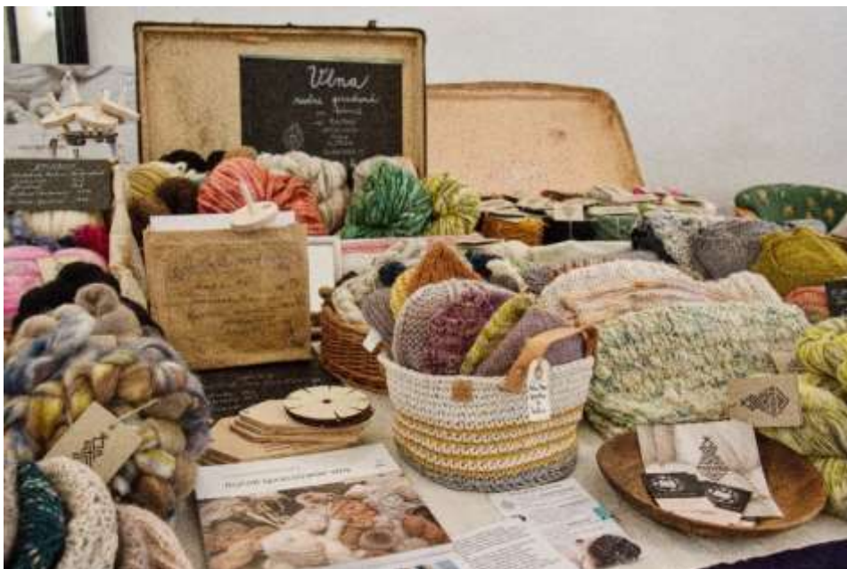
Propagácia udržateľnosti na Festivale vlny, Kammerhof