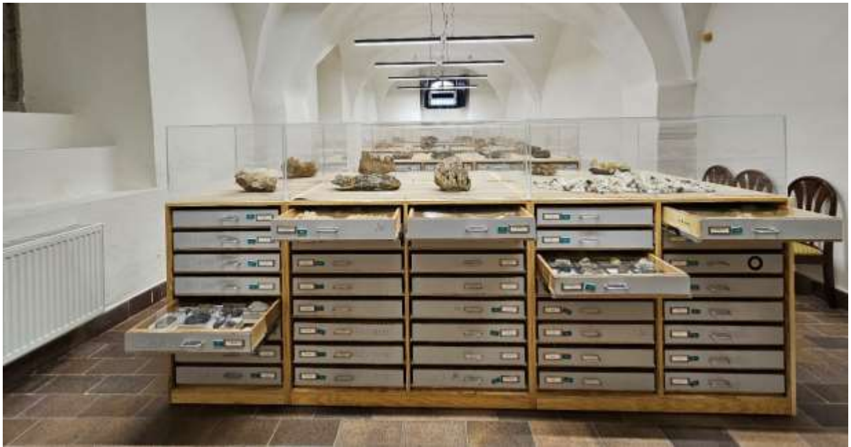
Nový otvorený výstavný depozitár zbierky geológia v Kaplnke sv. Ignáca v Kammerhofe