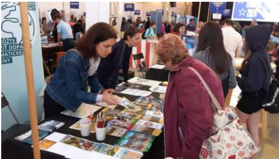
Prezentácia zeleného múzea a aktivít múzea na podujatí Deň Európy, Bratislava

Celoročne sme sa zameriavali na zmeny v našom každodennom prístupe k prostrediu, snažili sa využívať dažďovú vodu, separovať odpad, recyklovať nábytok, výstavný fondus. Zdieľanie kancelárskych potrieb, či kancelárie bez nádob na zmiešaný odpad sú už stálou súčasťou administratívneho priestoru Kammerhofu. Kontrolovali sme zavedené environmentálne opatrenia, upozorňovali na nedodržiavanie napr. správneho triedenia odpadu. Znižovali sme spotrebu energie na vykurovanie z ekonomických i environmentálnych dôvodov.