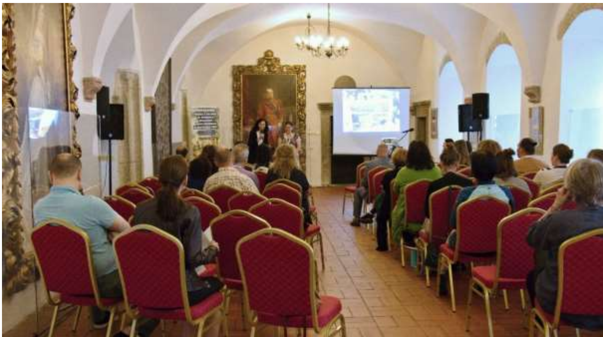
Medzinárodné kolokvium Museums & Galleries of the 21 st century together against the threats of climate crisis, Starý zámok