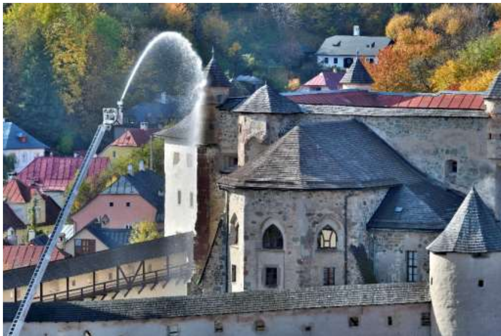
Simulácia hasičského zásahu, Starý zámok

zrealizovaná výmena núdzového osvetlenia, bola vykonaná obnova poškodených častí ochodzí a údržba dažďových strešných zvodov.