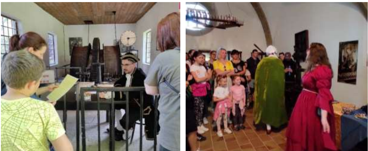
Noc múzeí a galérií, Banské múzeum v prírode a Starý zámok