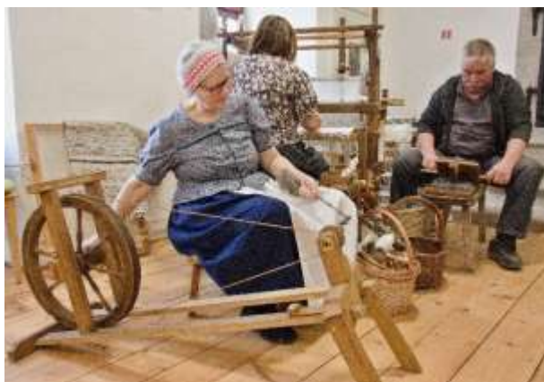
Festival vlny, 2. ročník, Kammerhof