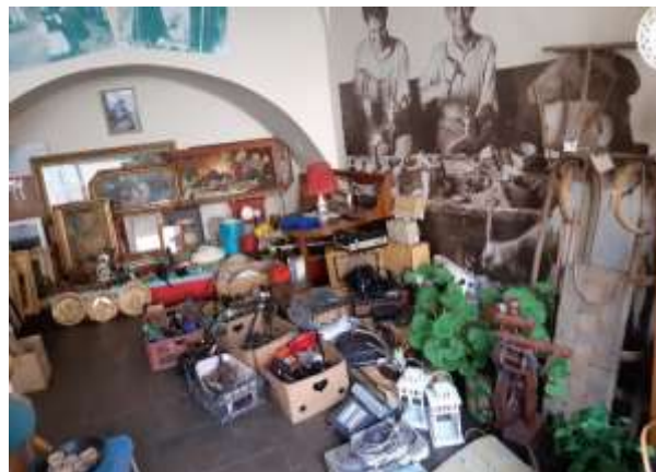
Bazár Haraburdy, Kammerhof