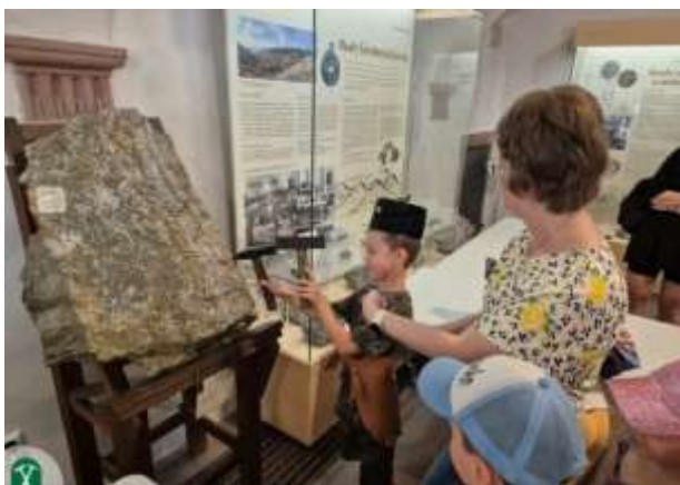
Rozprávka o baníkovi, Kammerhof