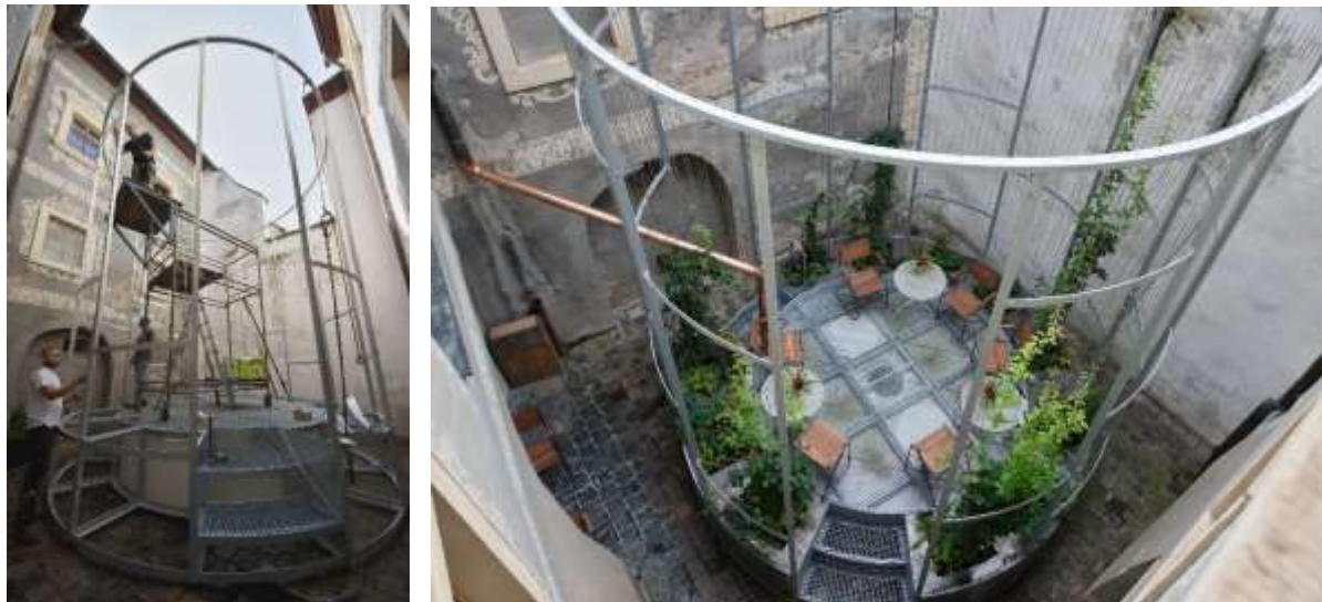
Revitalizácia átria, Galéria Jozefa Kollára

V átriu bol vytvorený objekt v tvare valca. Tento objekt má priemer cca 5 m a výšku 6 m. Objekt je samonosný, nezávisle stojaci v centre átria, zaťažený nádobou na zadržiavanie vody a zároveň aj nádobami na zeminu. Vyhýba sa akémukoľvek kontaktu s historickými fasádami budovy. Konštrukcia obrastená popínavou zeleňou je svojou živosťou v kontraste s ostatnými výstavnými priestormi galérie.