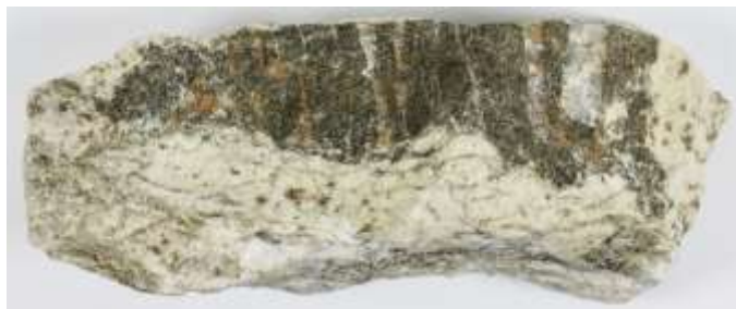
Akvizície mineralogickej zbierky v roku 2024: Adamit, Ojuela, Mexiko a Oxyskoryl, Zlatá Idka