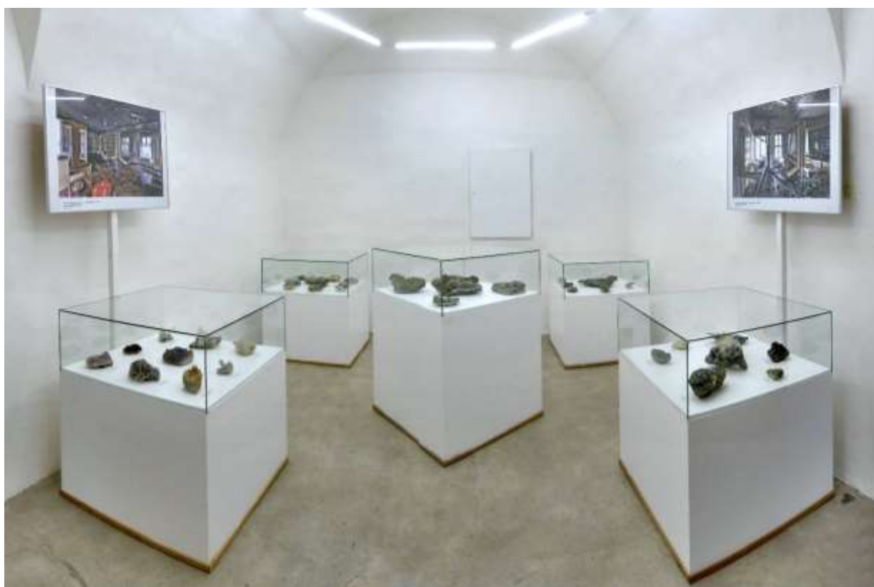
Výstava Unikli plameňom, Galéria Jozefa Kollára