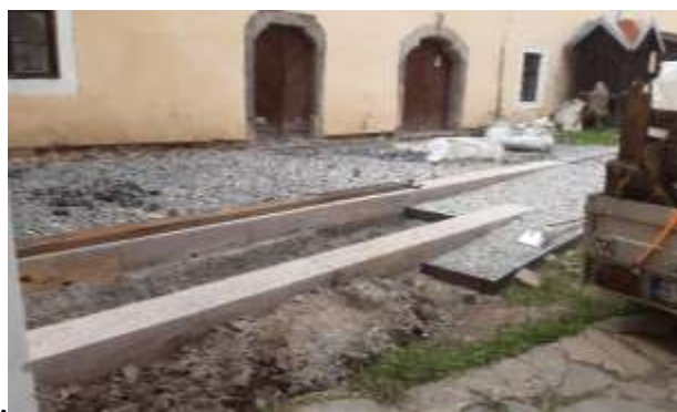
Obnova časti nádvorí, Kammerhof