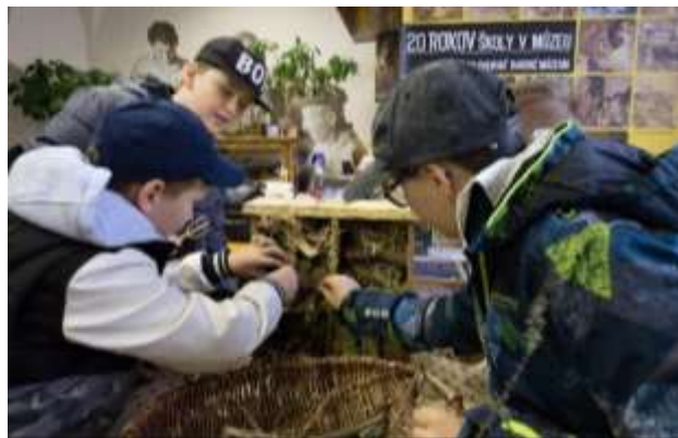
Deň Zeme, Kammerhof

Svetový deň životného prostredia si múzeum pripomenulo účasťou na podujatí Festival Zeme v Banskej Bystrici. Podujatie sa uskutočnilo 6.6.2024 a múzeum do programu prispelo s aktivitou Hravé určovanie minerálov a možnosťou pre deti zostaviť si aj vlastný vzorkovník minerálov.