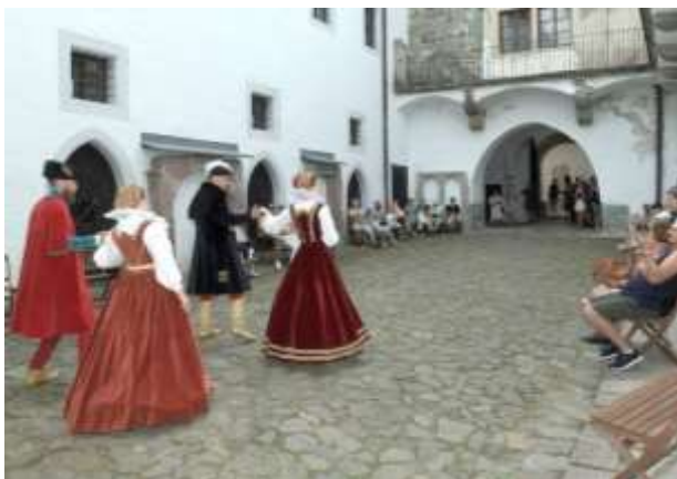
Festival Citadela, Starý zámok