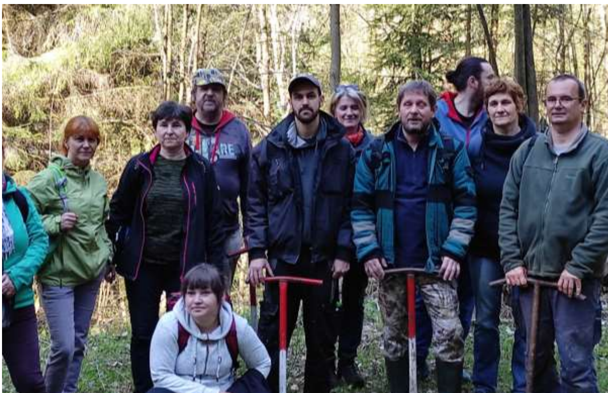
Výsadba stromčekov v rámci záväzku múzea na znížovanie uhlíkovej stopy.