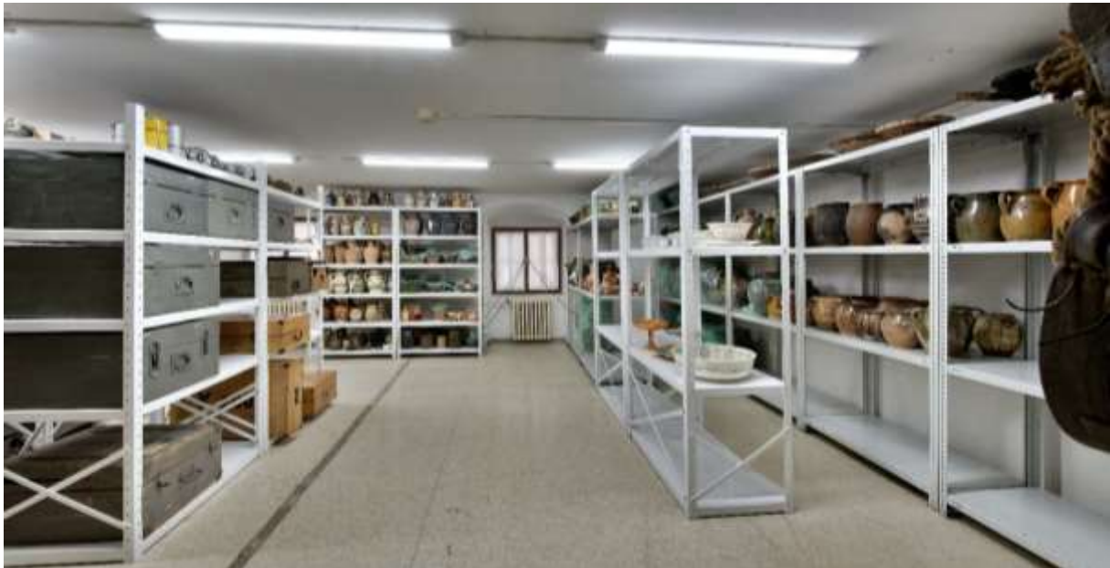
Novovytvorený materiálový depozitár špecializovaný na keramiku.

V rámci prác bola dokončená montáž nových kovových regálov – umiestnené sú v depozitári D 204. Depozitárne priestory v Kammerhofe sa tiež pripravili na prevoz zbierkových predmetov z kovu, dreva, plastu a zmiešaných materiálov z depozitára v Starom zámku, ktorý sa bude uskutočňovať v priebehu roku 2023.