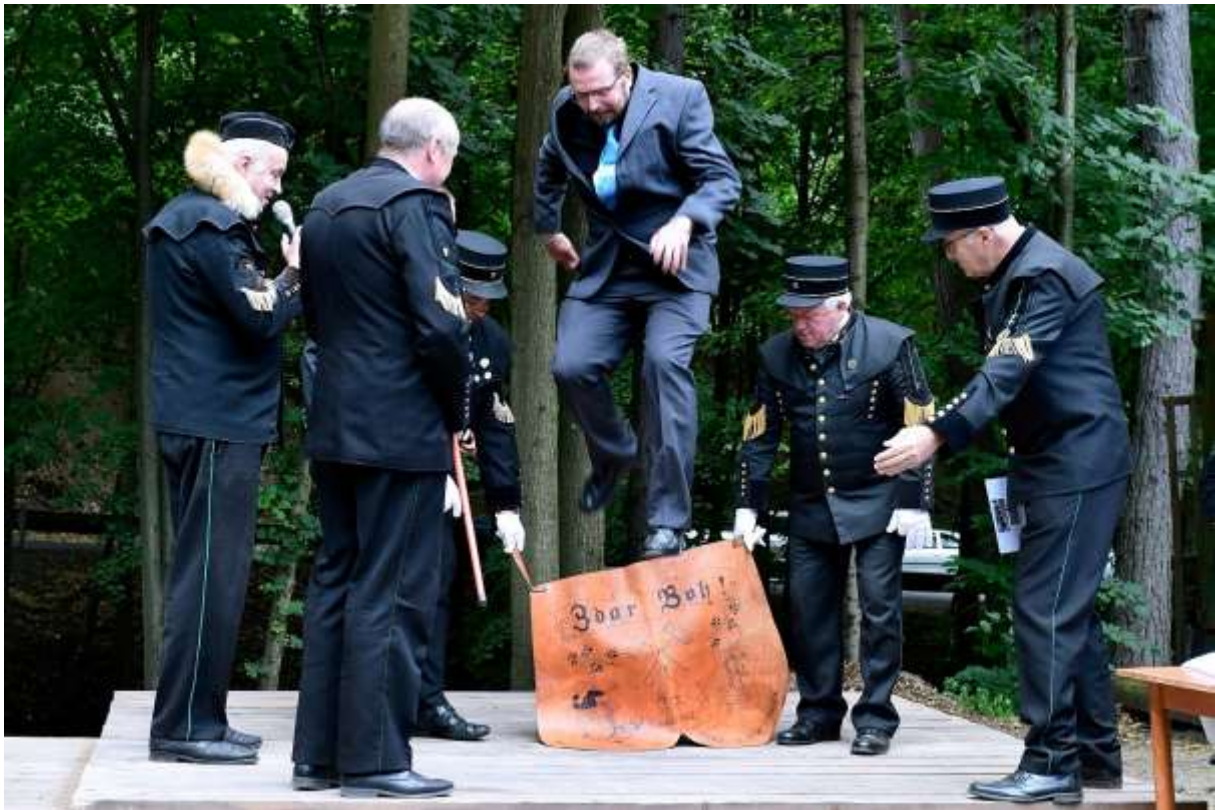
Banícky šachtág, Banské múzeum v prírode.