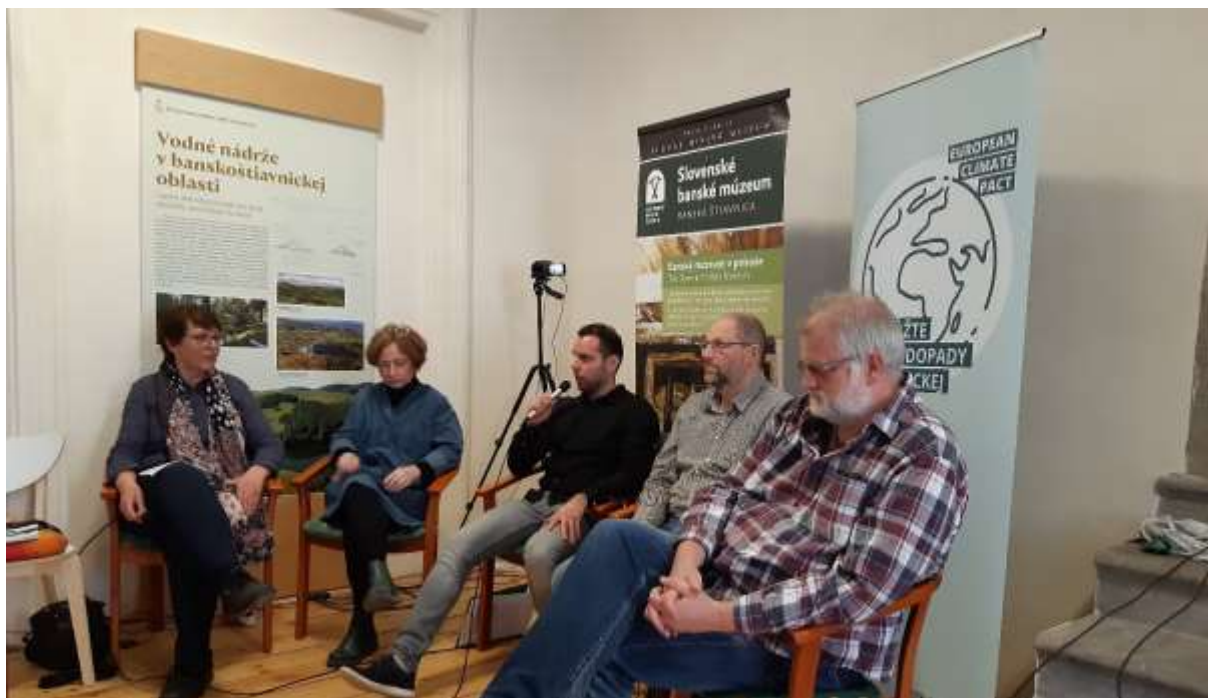
Stretnutie ambasádorov Európskeho klimatického paktu, verejná diskusia o udržateľnej doprave v Banskej Štiavnici, Kammerhof.