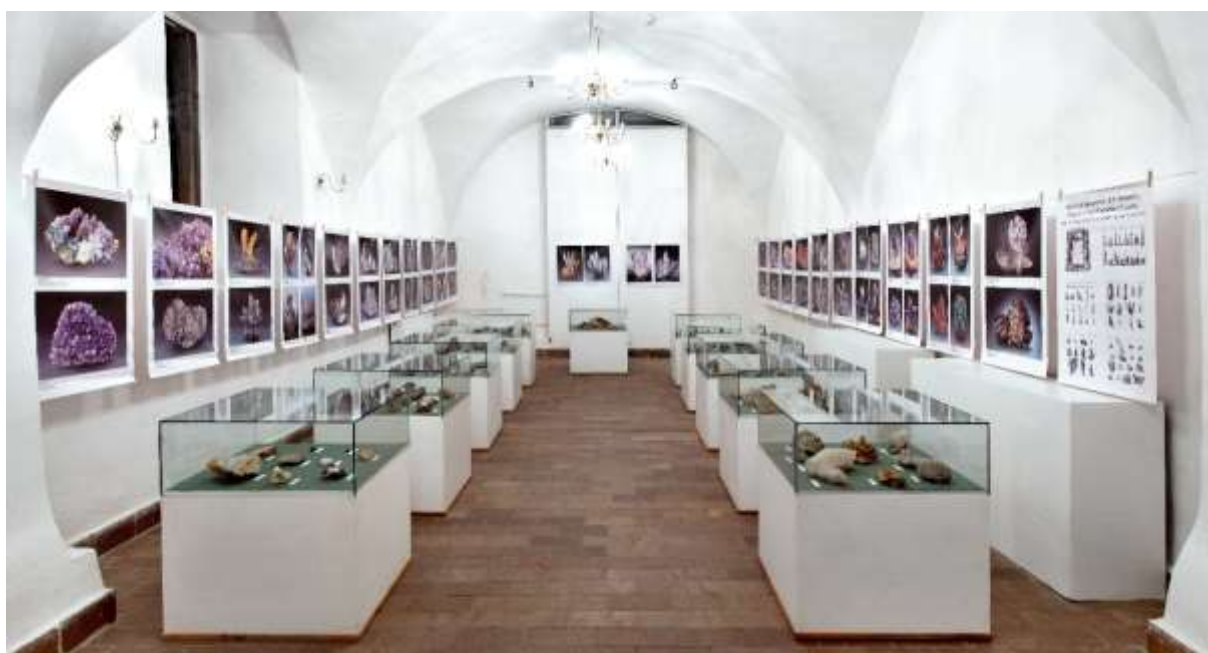
Výstava: Kremeň – kráľ nerastov, Kammerhof.