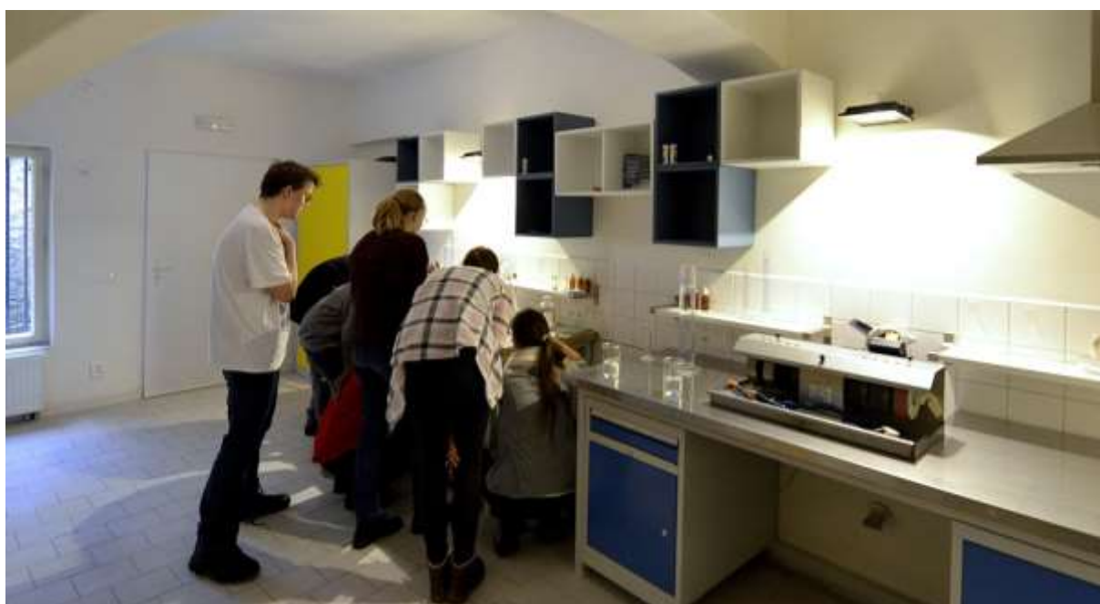
Bádateľské experimenty v Geobádateľni, Berggericht.