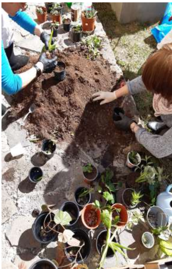
Príprava zeleného výmenníka rastlín, Kammerhof.