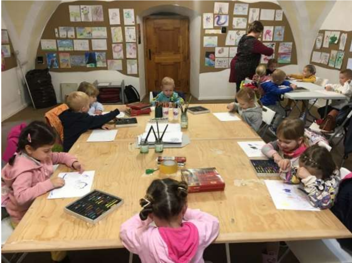
Deň otvorených dverí v Galérii Jozefa Kollára pre DETI – tvorenie v rámci výstavy Tiché správy Zeme.