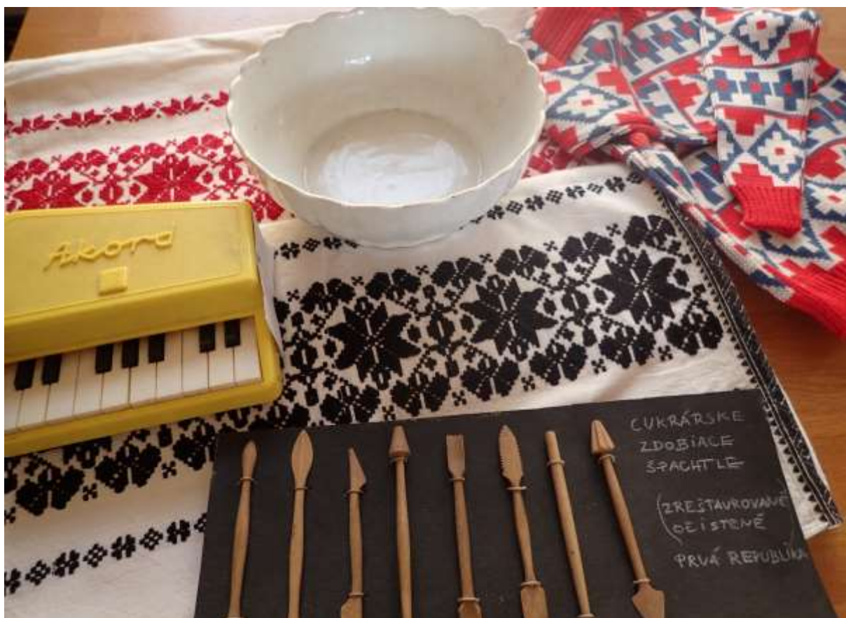
Akvízia zbierkového fondu Etnológia a Novšia história v roku 2022.