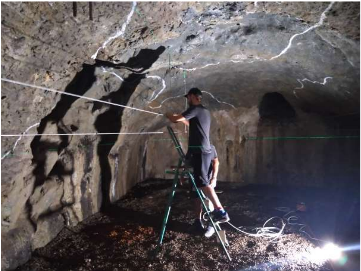
Zameriavanie podzemných priestorov.

Prekážkou pri riešení havarijných stavov je absencia technickej projektovej dokumentácie, statických posudkov, rozpočtov. Rovnaká je situácia v oblasti znižovania energetickej náročnosti objektov v správe SBM. V roku 2022 sa zásadne zvýšili ceny energií, SBM sa však nepodarilo získať kapitálový transfer na spracovanie technickej projektovej dokumentácie na zníženie energetickej náročnosti troch objektov v správe (Kammerhof, Galéria J. Kollára a Bergergericht), ktorej spracovanie mohlo otvoriť múzeu možnosti uchádzania sa o mimorozpočtové zdroje.