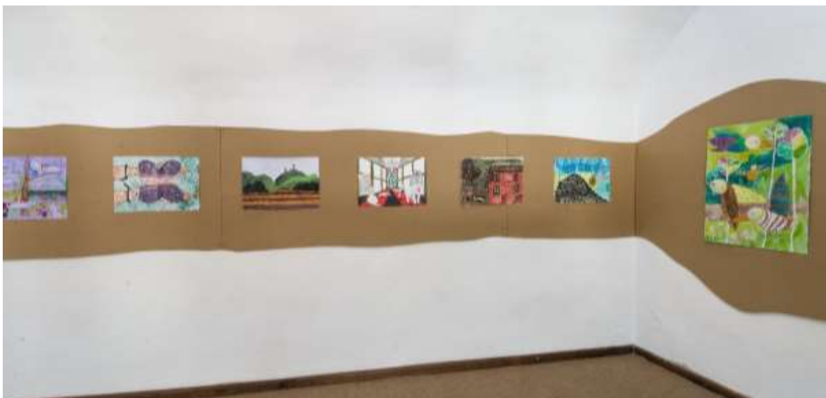
Výstavný projekt: Tiché správy Zeme, Galéria Jozefa Kollára.