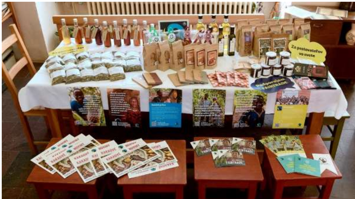
Férové ráno – zapojenie sa do kampane zameranej na fair-trade podporu pri pestovaní kaka, Kammerhof.

SBM bolo spoluorganizátorom Jesennej univerzity architektúry 2022 , ktorej účastníci navštívili Kammerhof, Starý zámok, Nový zámok a Galériu Jozefa Kollára.