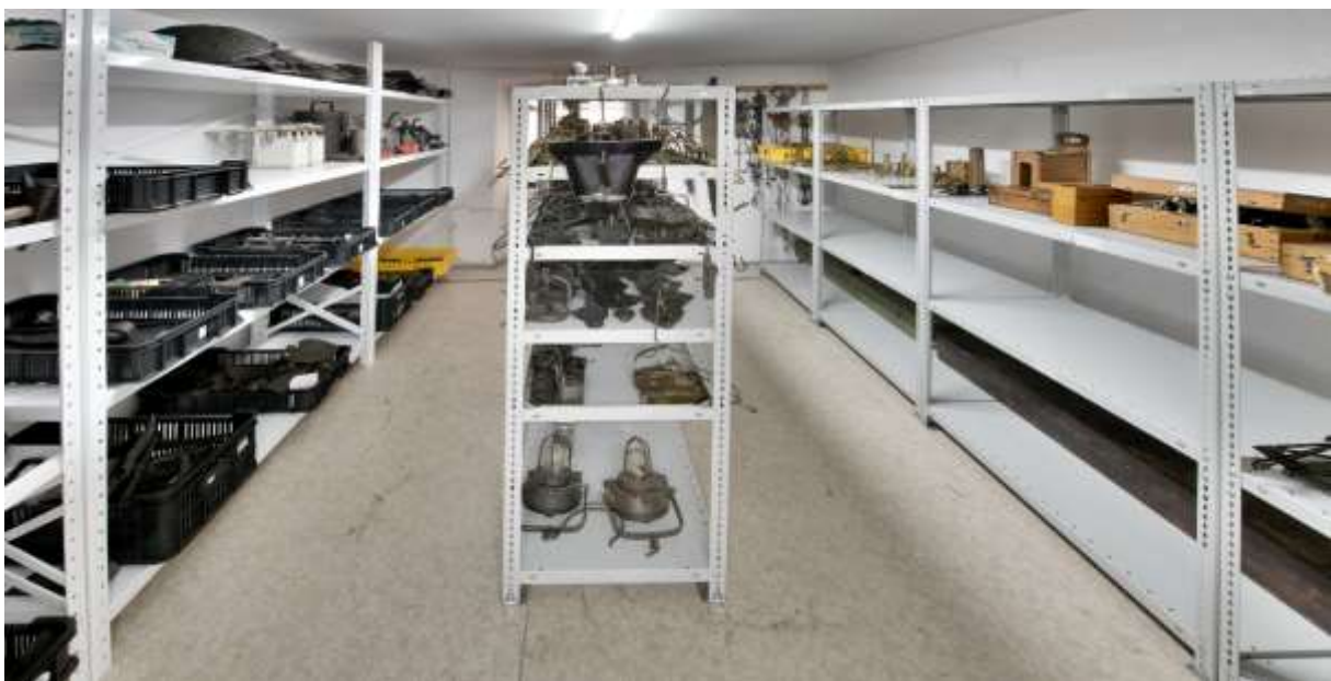
Novovytvorený depozitár špecializovaný na kov.