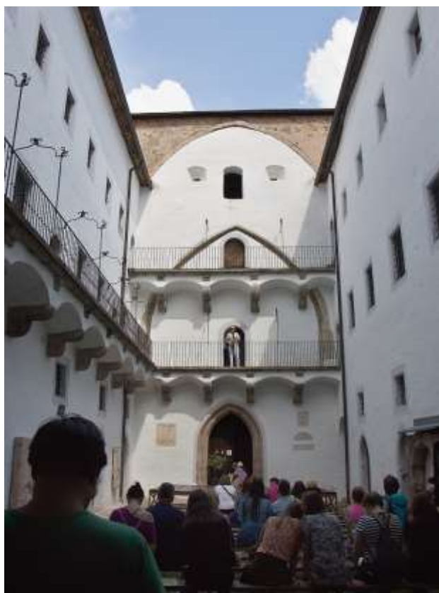
Minifestival Citadela – vystúpenie hudobníka, Starý zámok.