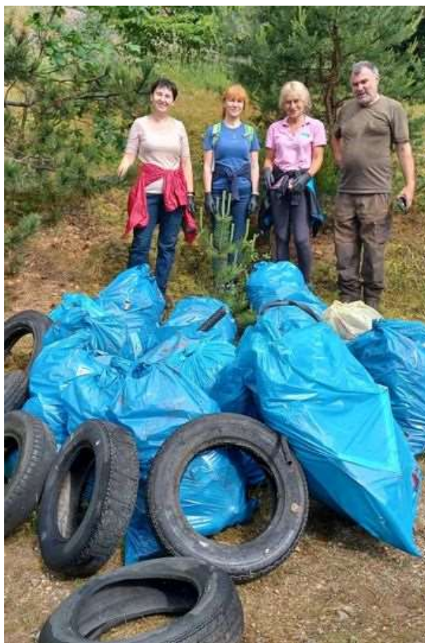
Zapojenie sa do dobrovoľníckej aktivity URBACT-u..