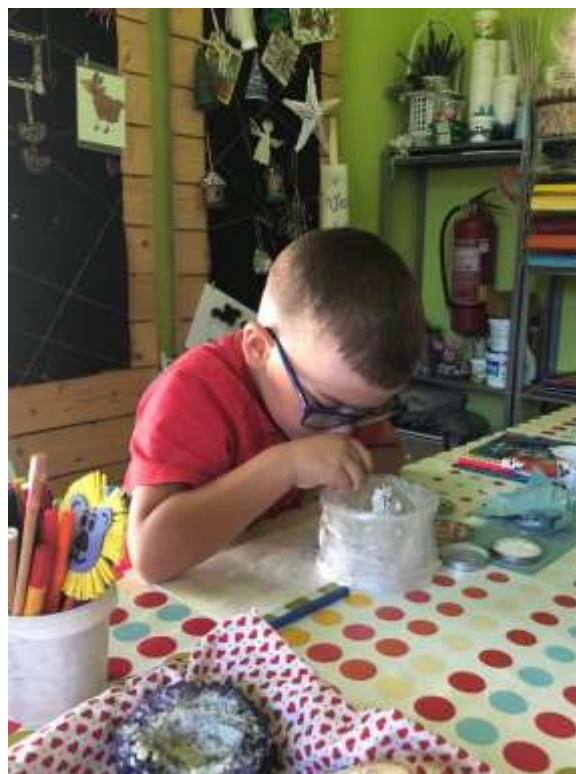
Prázdninové stredy a soboty v Uhoľnej expozícii v Handlovej.