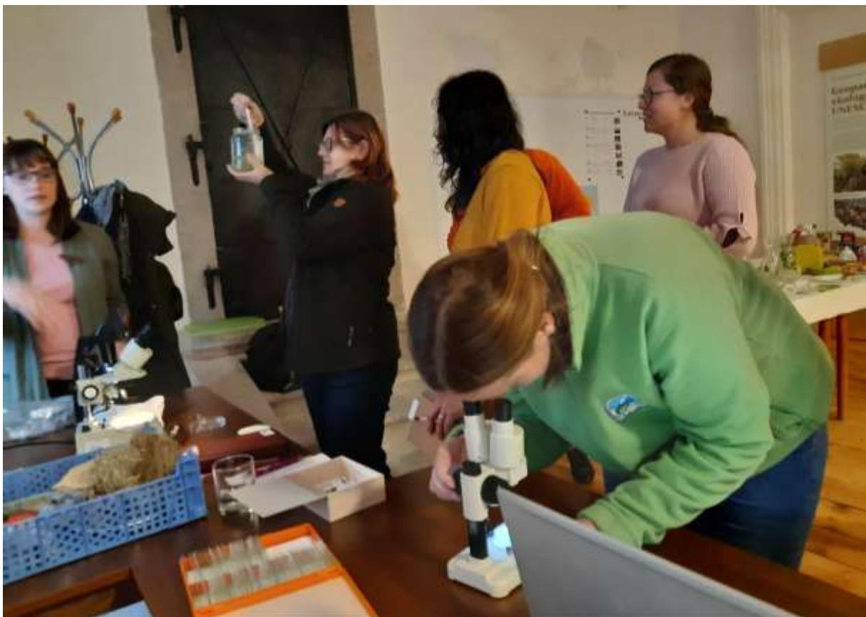
Envirohry 2022, stretnutie rezortných kolegov pre environmentálnu výchovu a vzdelávanie, Kammerhof.