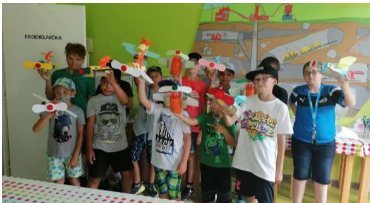
Tvorivé aktivity v Ekodielničke, Handlová.

Aktivity Školy v múzeu v Dielničke v Kammerhofe mohli opäť pokračovať bez obmedzení, čo sa prejavilo aj v návštevnosti. Pravidelnými návštevníkmi boli deti hlavne z miestnych materských škôl a žiaci základných škôl. Tvorivé dielne počas jarých a letných prázdnin uspokojili mnohých pravidelných i nových záujemcov – rodiny s deťmi, účastníkov letných táborov, návštevníkov mesta i seniorov.