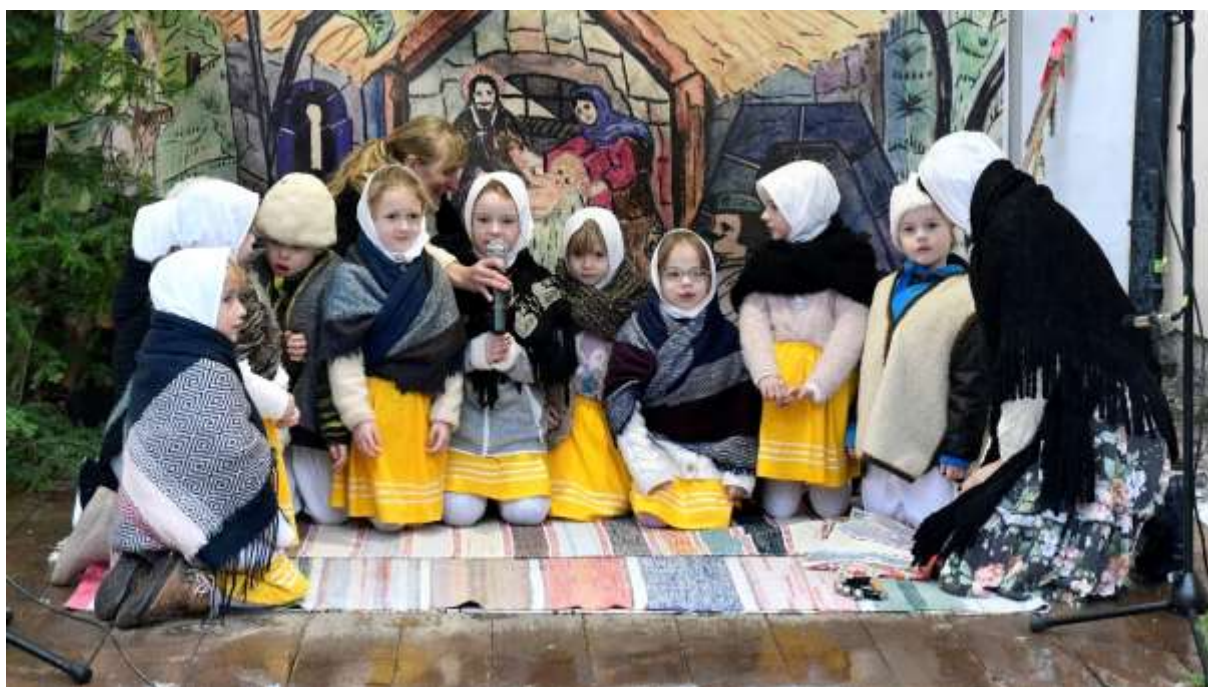
Vystúpenie škôlkarov MŠ Bratská na Štiavnickom vianočnom jarmoku, Kammerhof.