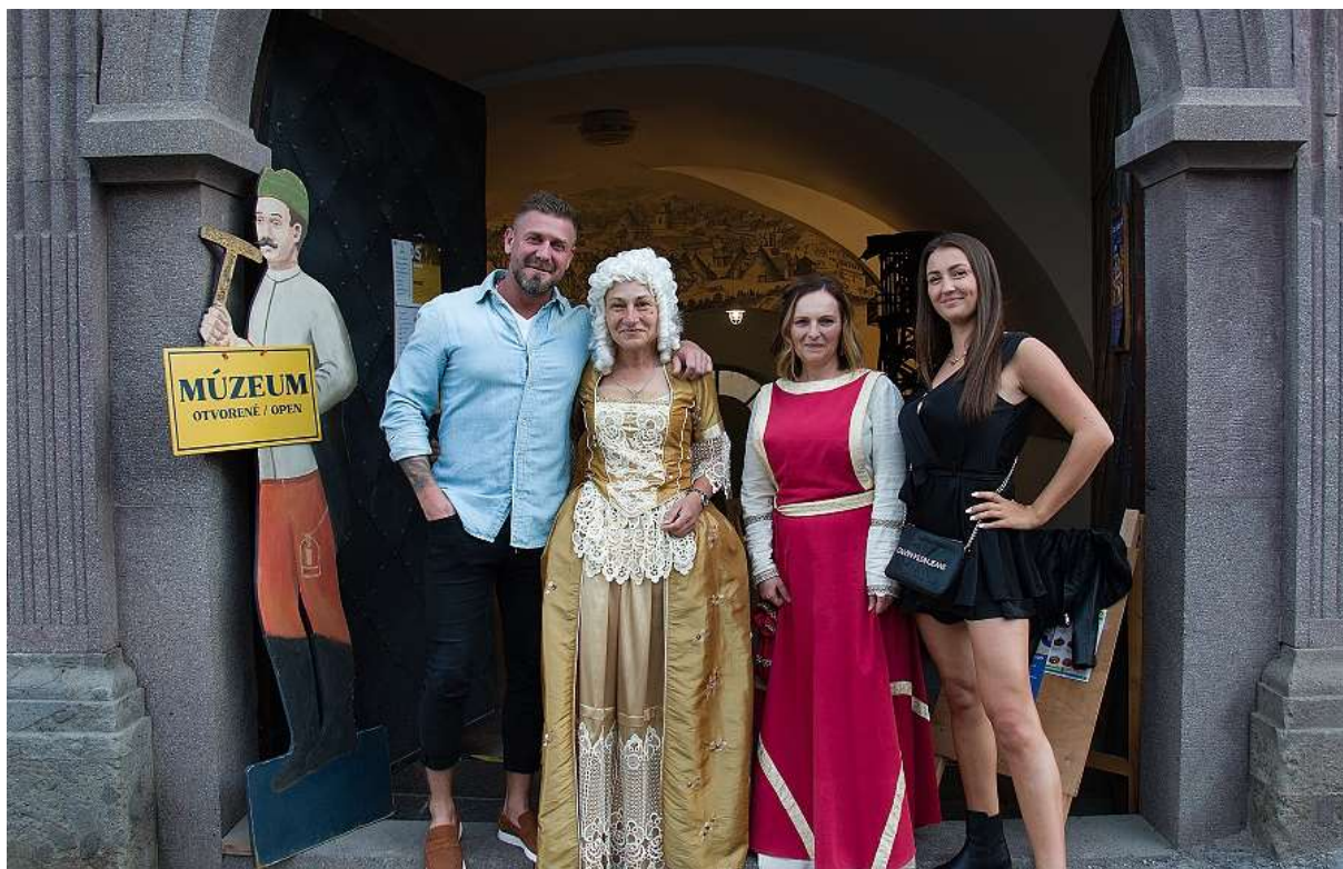
Tajomstvá Kammerhofu - zážitkové sprevádzanie v expozícii Baníctvo na Slovensku počas Noci múzeí a galérií, Kammerhof.