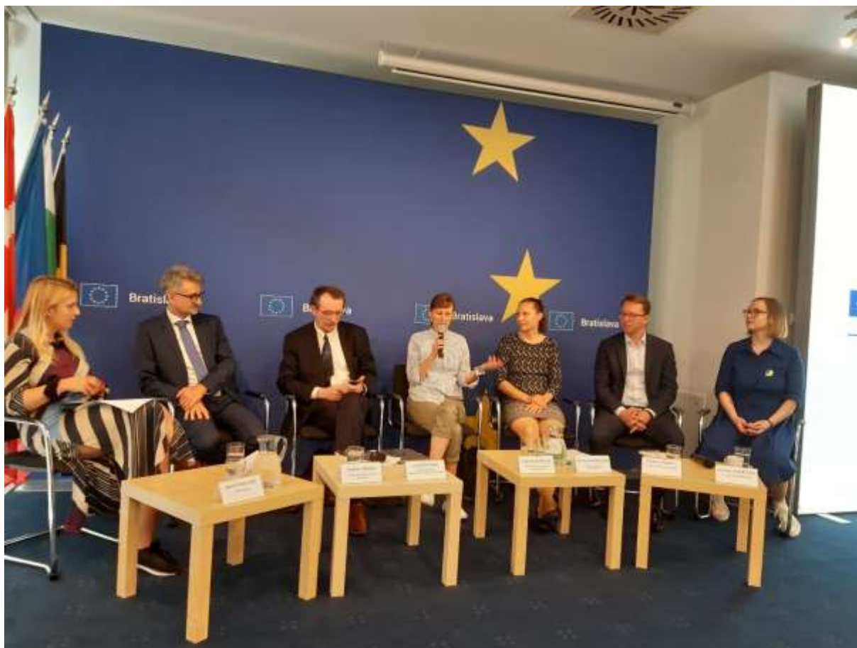
Múzeum ako ambasádor Európskeho klimatického paktu na mediálnom brífingu v Bratislave.