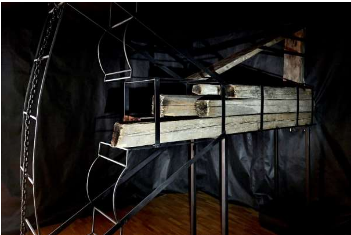
Výstava: Stroj, ktorý zmenil svet: Príbeh ohňového stroja Isaaca Pottera, Berggericht.