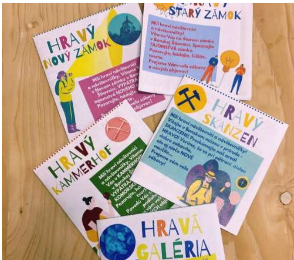
Séria detských sprievodcov pre interaktívne spoznávanie expozícií múzea.

Na vzdelávacích aktivitách v Geobádateľni sa zúčastnilo 723 návštevníkov, ryžovanie zlata v Kammerhofe absolvovalo 778 detí a rodičov, program Hráme sa na remeselníkov v Dielničke v Kammerhofe absolvovalo 3 500 návštevníkov. Ekodielničku v Uhoľnej expozícii Handlová navštívilo 239 návštevníkov. V roku 2022 sa podarilo pripraviť Letné tvorivé dielne v Dielničke v Kammerhofe s návštevnosťou 1 082 návštevníkov.