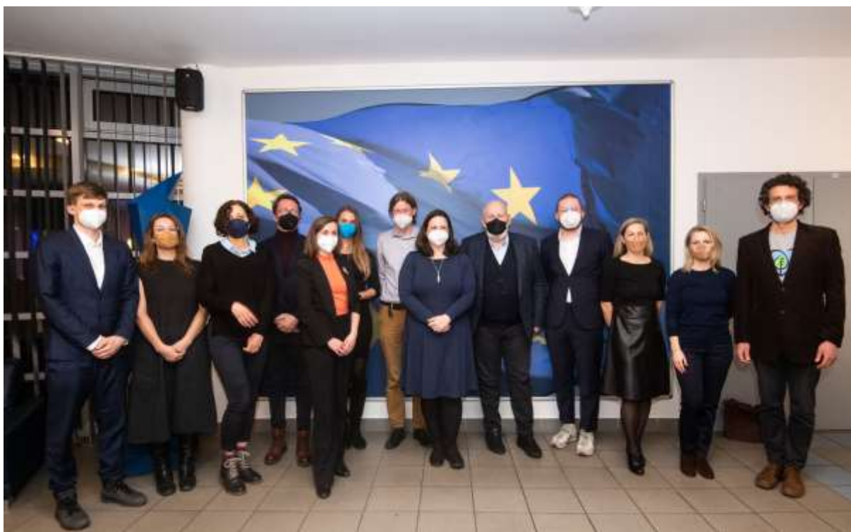
Stretnutie s F. Timmermansom, výkonným podpredsedom Európskej komisie, Bratislava.