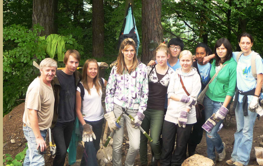
Tím archeologického výskumu /sezóna 2009/